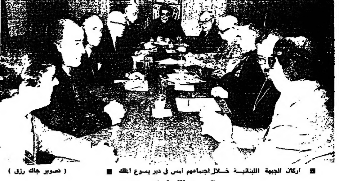
أركان الجبهة اللبنانية خلال اجتماعهم أمس في دير يسوع الملك